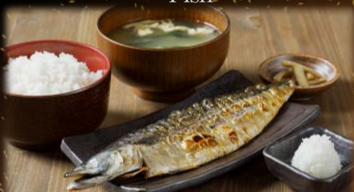
さば文化干し定食 790円(税込869円)