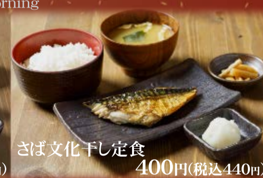
さば文化干し定食 400円(税込440円)