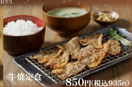
牛焼定食 850円(税込935円)