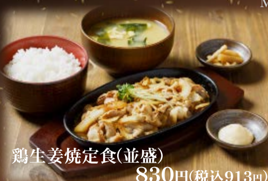
鶏生姜焼定食(並盛) 830円(税込913円)