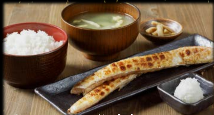
サーモンハラス干し定食 790円(税込869円)