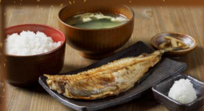
ほっけ定食半身 780円(税込858円)